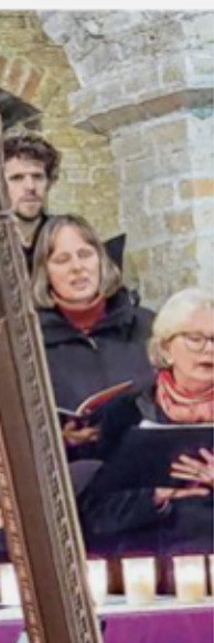
ierte der Chor „Cä- Kirche St. Stephan.