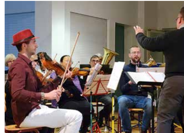
Das Orchester der Dießener Musikschule unter der Leitung von Thomas Schmidt, zeigt was es kann.