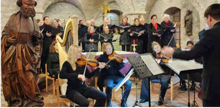
Cäcilia Nova, der Chor der Musikschule Dießen, begeisterte die Zuhörer beim Adventskonzert in der Stephanskirche.